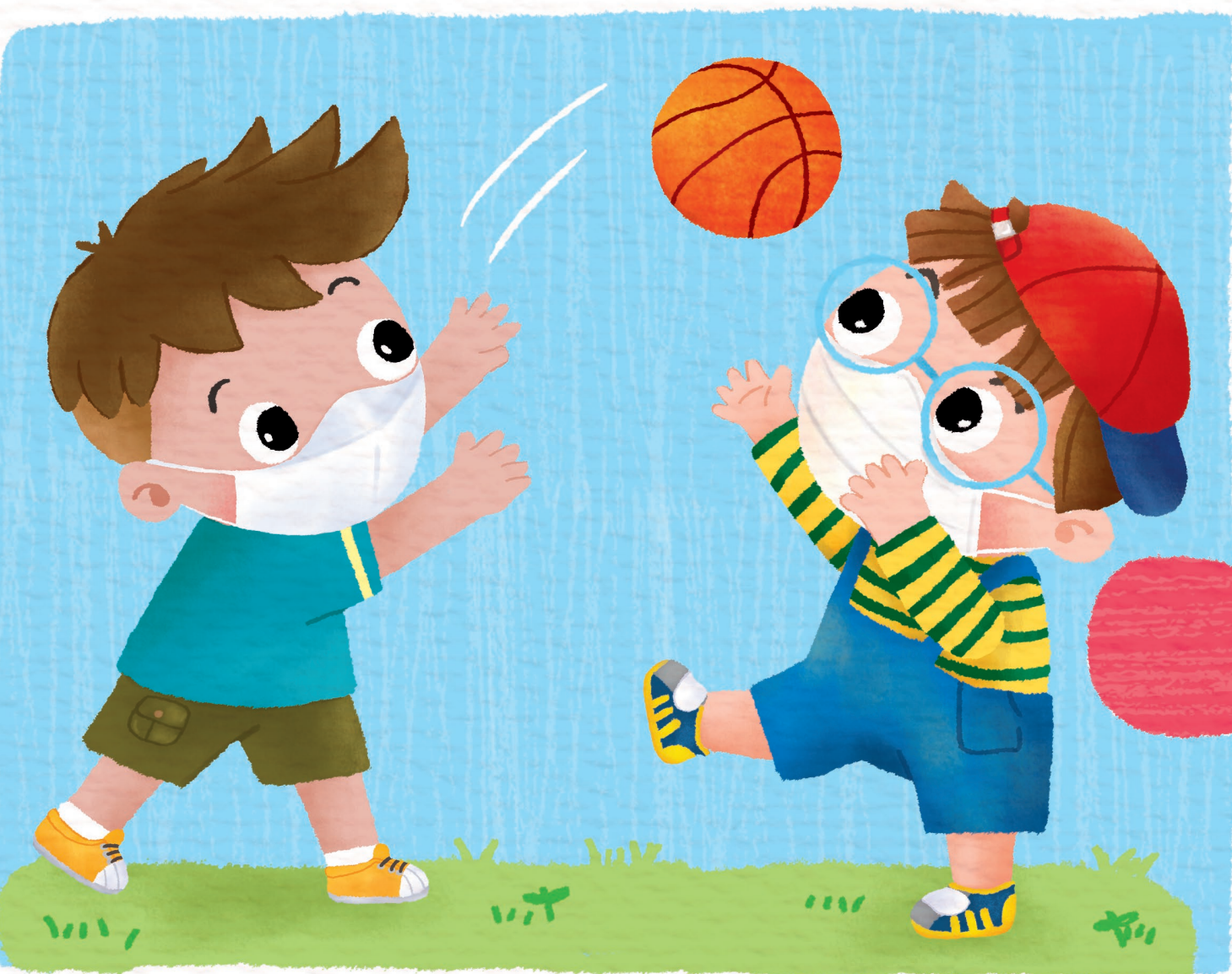
พื้กับเพื่อน ไปเล่นด้วยกัน สนุกสุขสันต์ ทุกวันดีดี