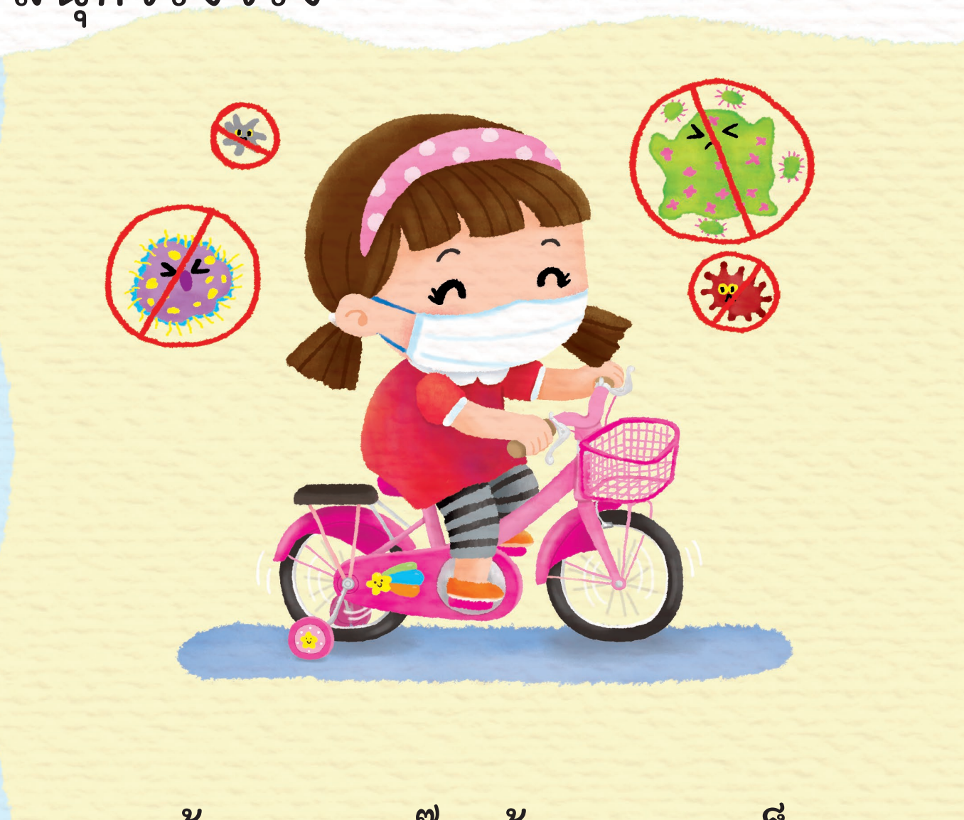
แก้คาถาตุงตุง ด้วยความแข็งแรง ร่างกายแข็งแรง เชื้อร้ายหมดไป