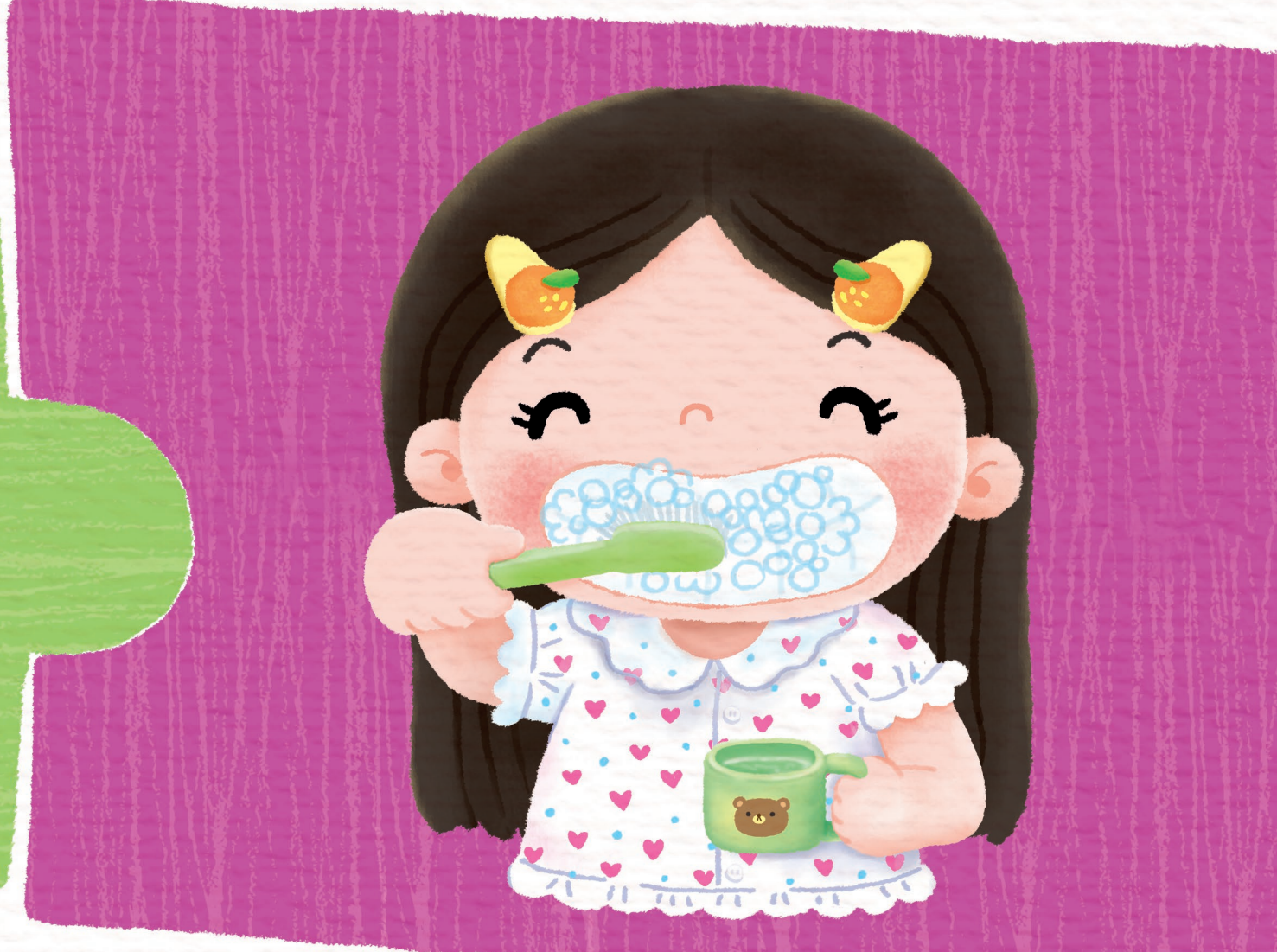
ล้างแปรงฟันสะอาดทุกซี่ มีฟันสุขภาพดี ยิ้มอย่างมั่นใจ