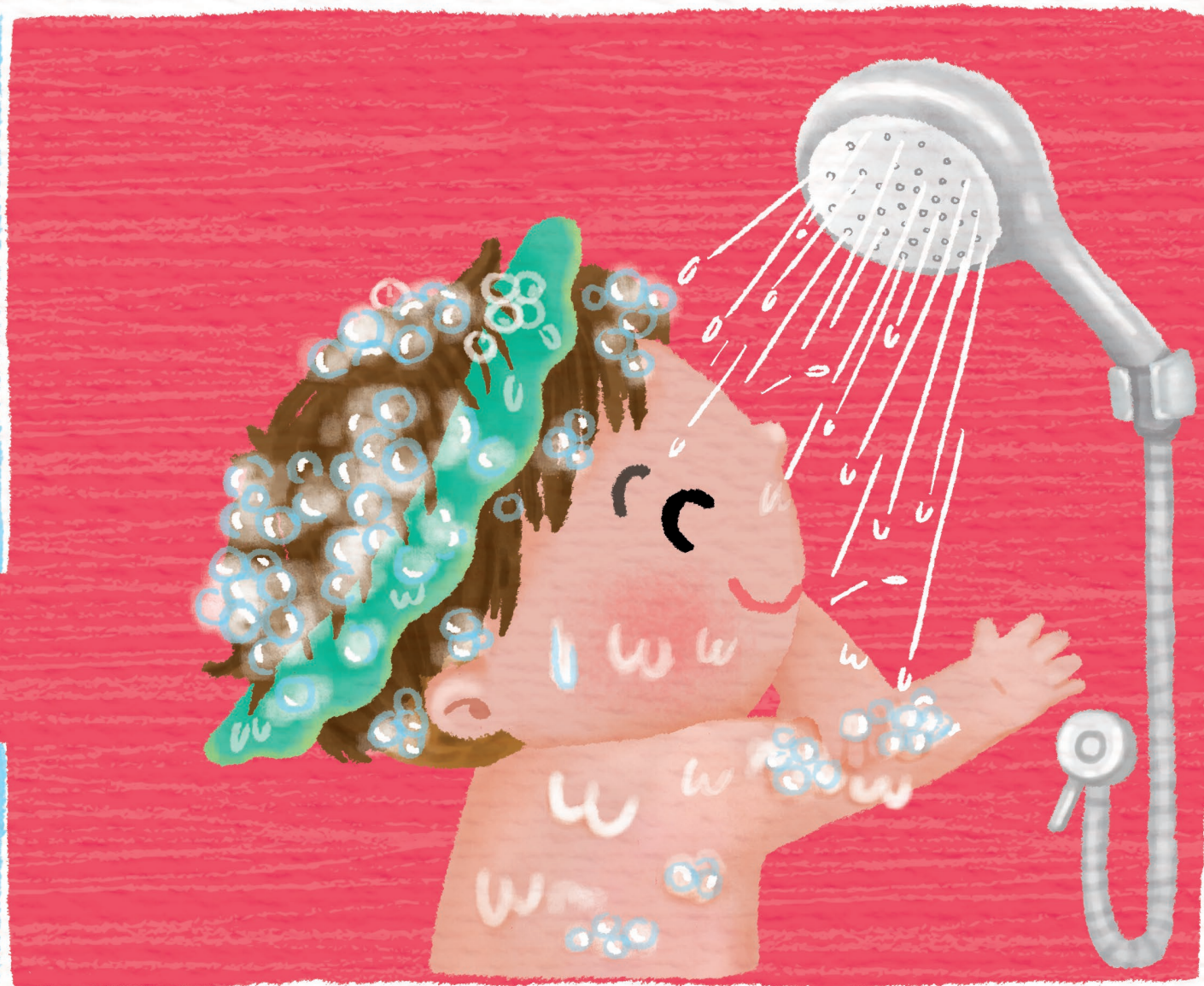
สายหมอกกลับบ้านเร็วรี เป็นเด็กดีดี อาบน้ำชื่นใจ