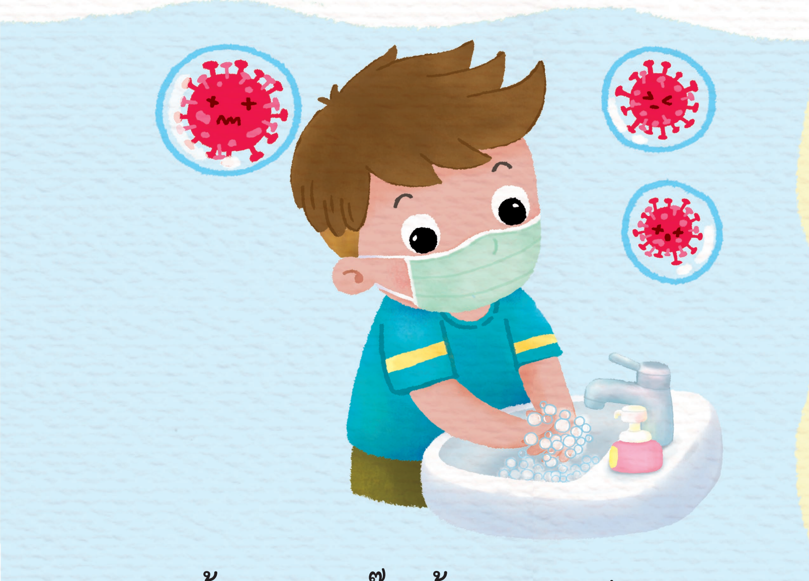
แก้คาถาตุงตุง ด้วยความสะอาด ร่างกายปราศจาก เชื้อโรคตัวร้าย