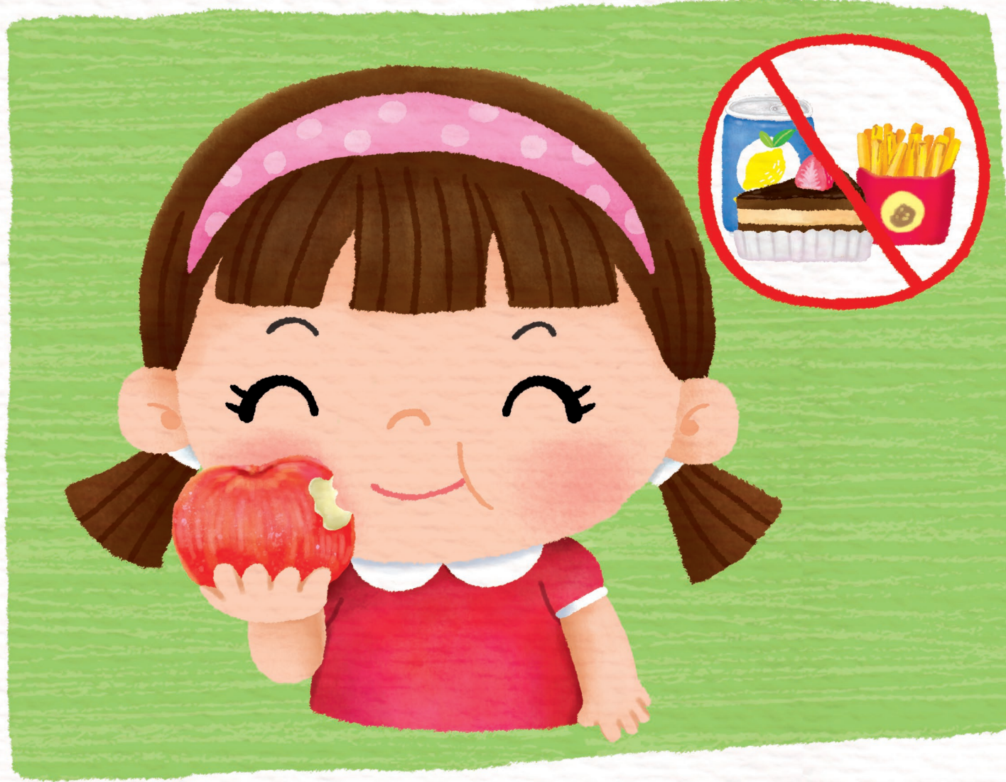
นานะกินผักผลไม้ ลด หวาน มัน แป้ง กินแล้วหยิบแปรง หยิบยาสีฟัน