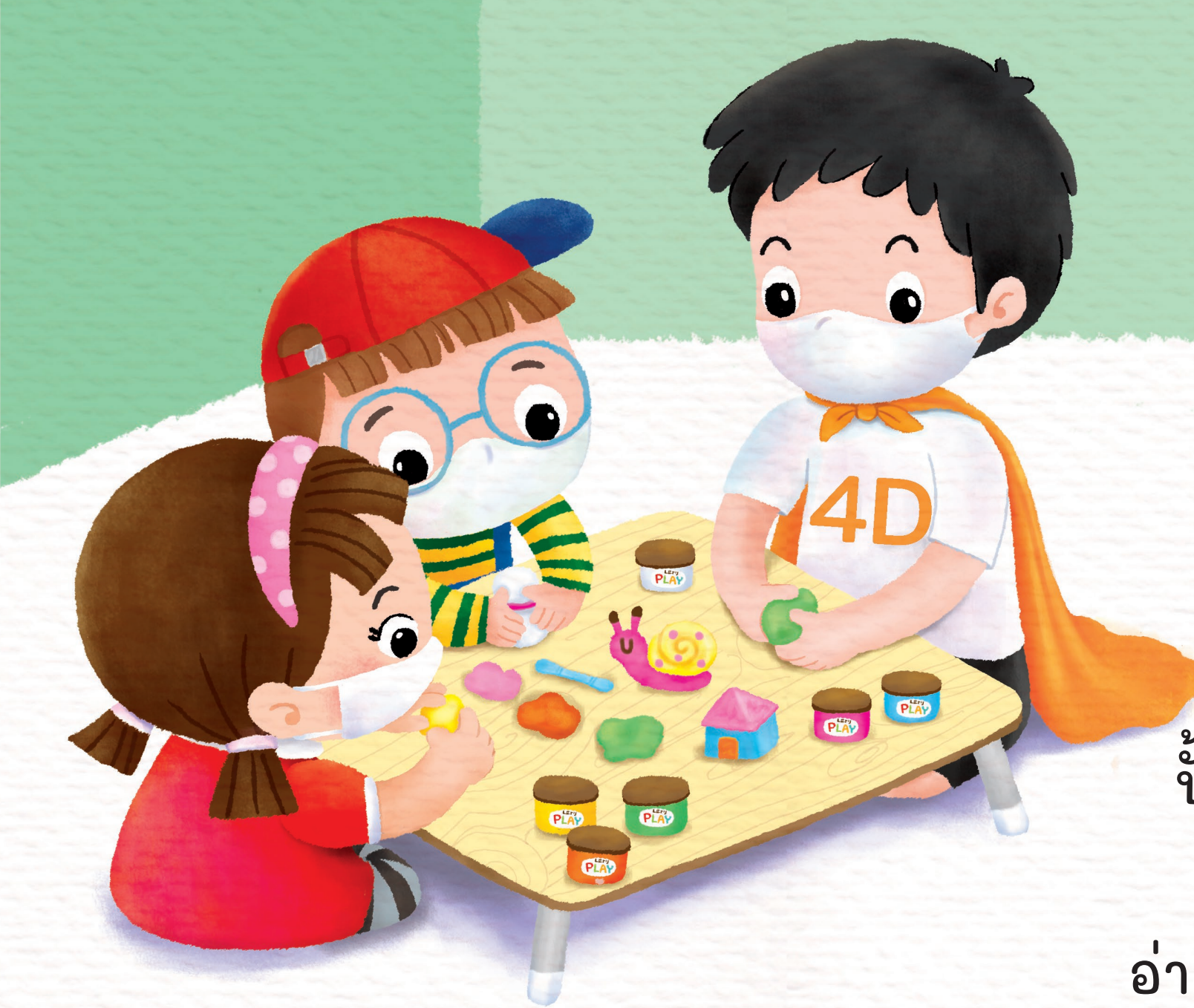
ปั้นแป้งด้วยกัน สุขสันต์สดใส อ่านนิทานเพลินใจ สนุกจริงจริง